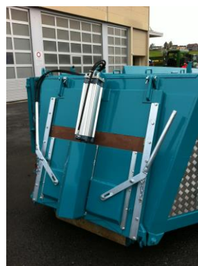
Pneum. Entleerungsklappe mit 2 Handauslaufschiebern