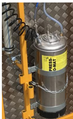
Sprühergerät 10 Liter

Vorteile: - Zeitersparnis, da das Einsprühen innert 4 Sek. passiert - Kein gefährliches rumklettern an der Thermomulde - Keine Absturzgefahr, dadurch keine unfallbedingten Arbeitsausfälle - Kein Einatmen von gesundheitsschädlichen Dämpfen - Einfaches und sicheres Betanken aus Grossgebinden